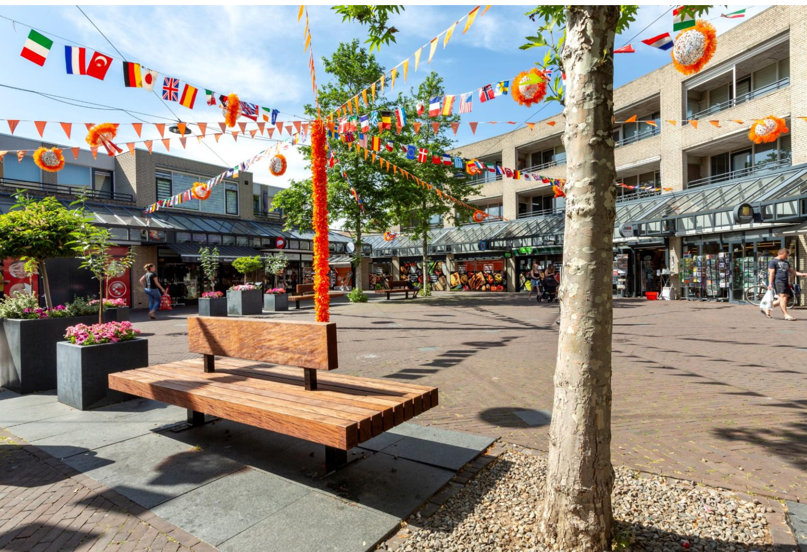
Winkelcentrum Brouwhorst te Helmond