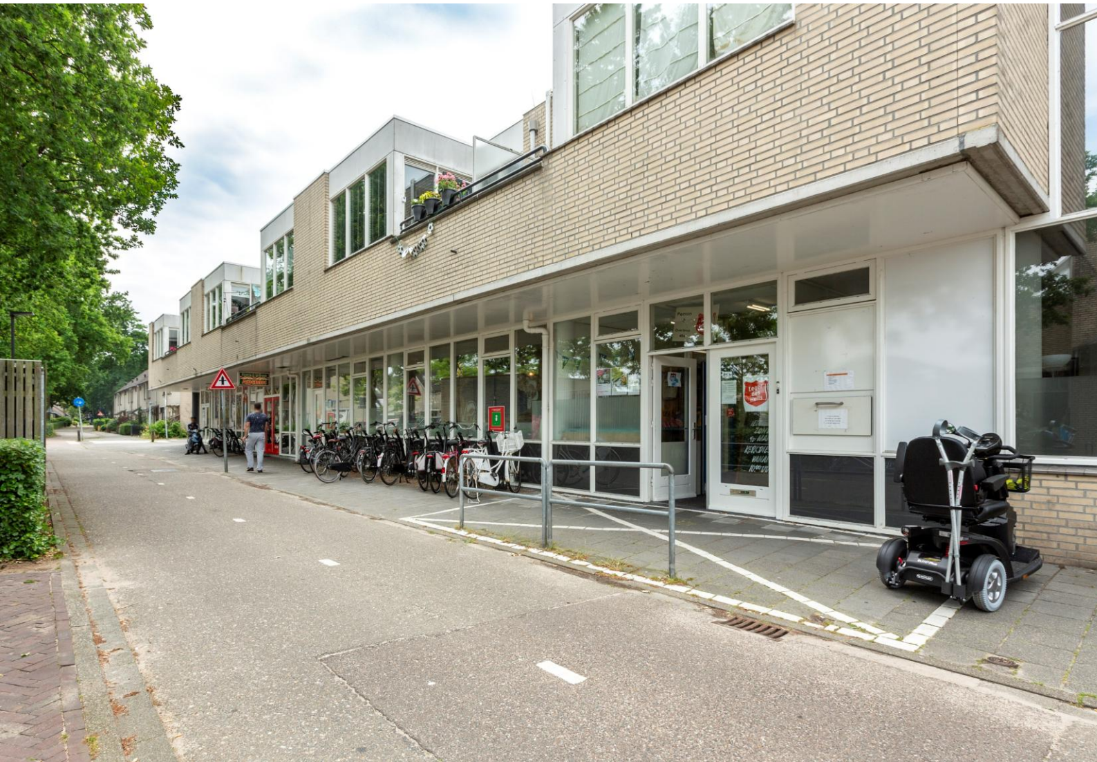
Winkelcentrum Brouwhorst te Helmond