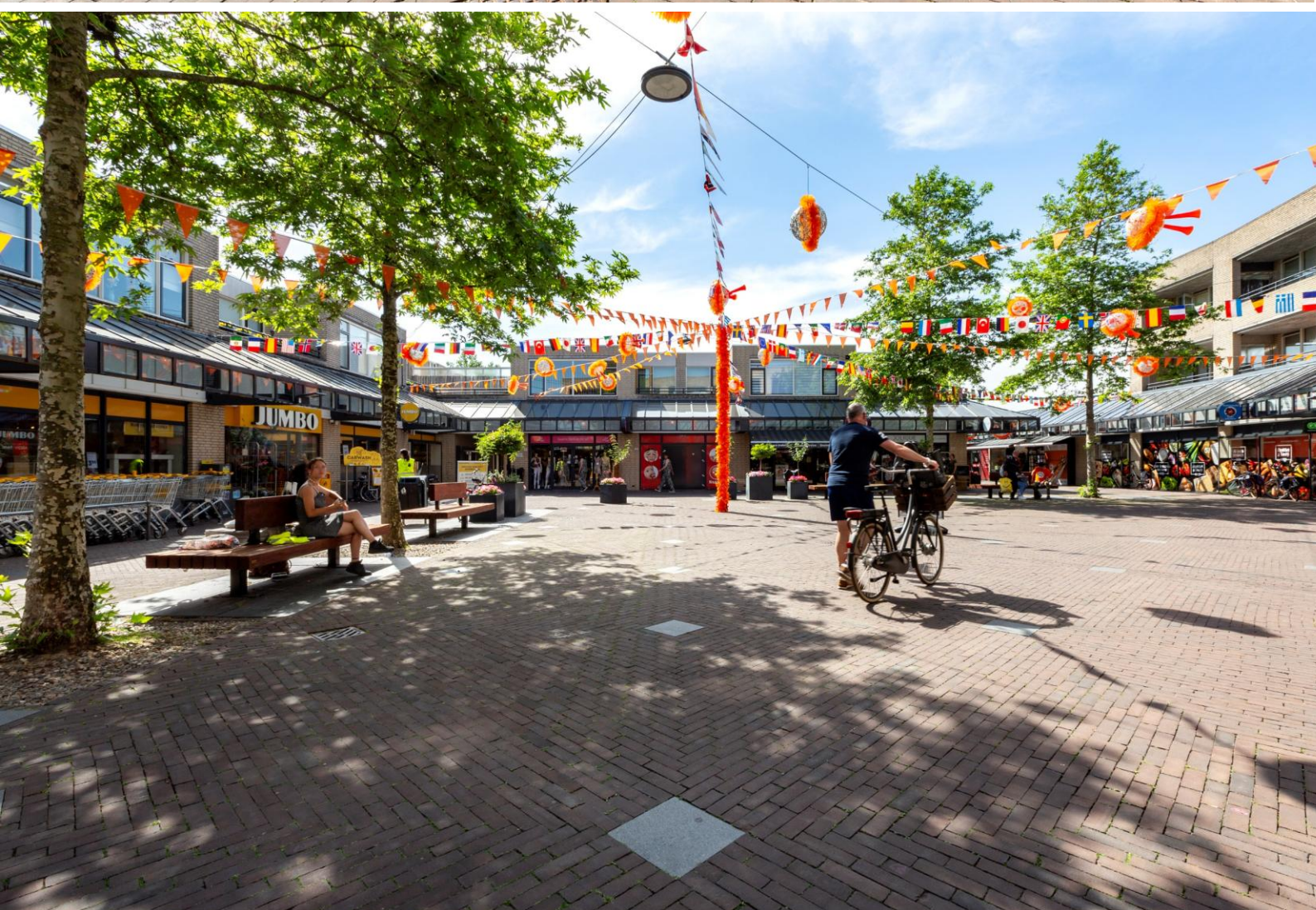
Winkelcentrum Brouwhorst te Helmond