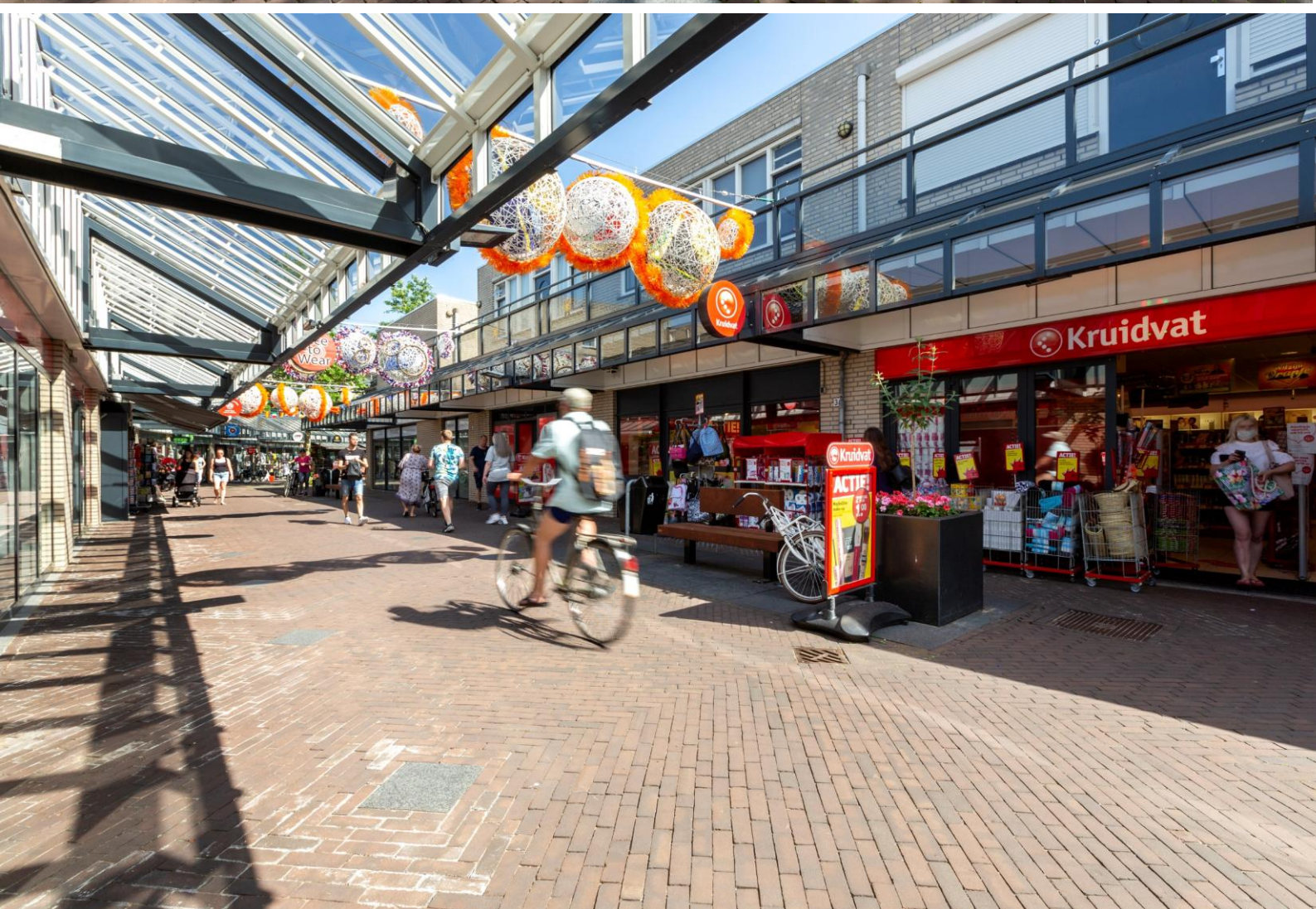
Winkelcentrum Brouwhorst te Helmond