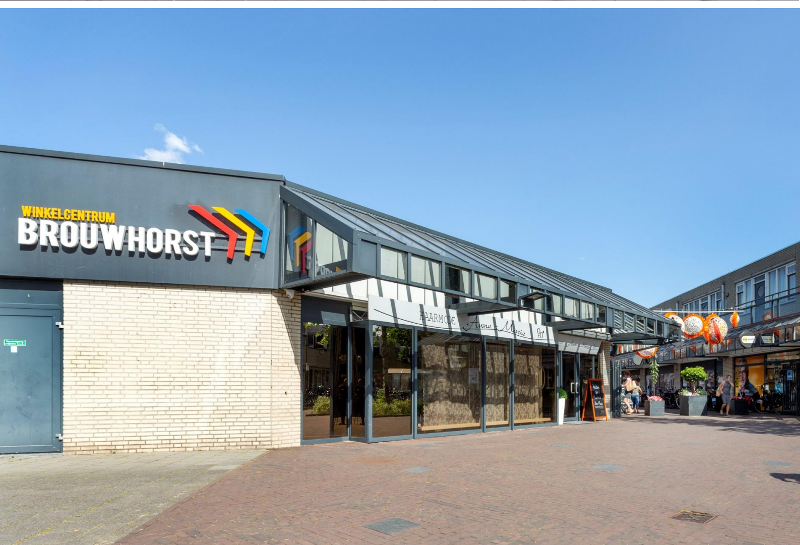
Winkelcentrum Brouwhorst te Helmond