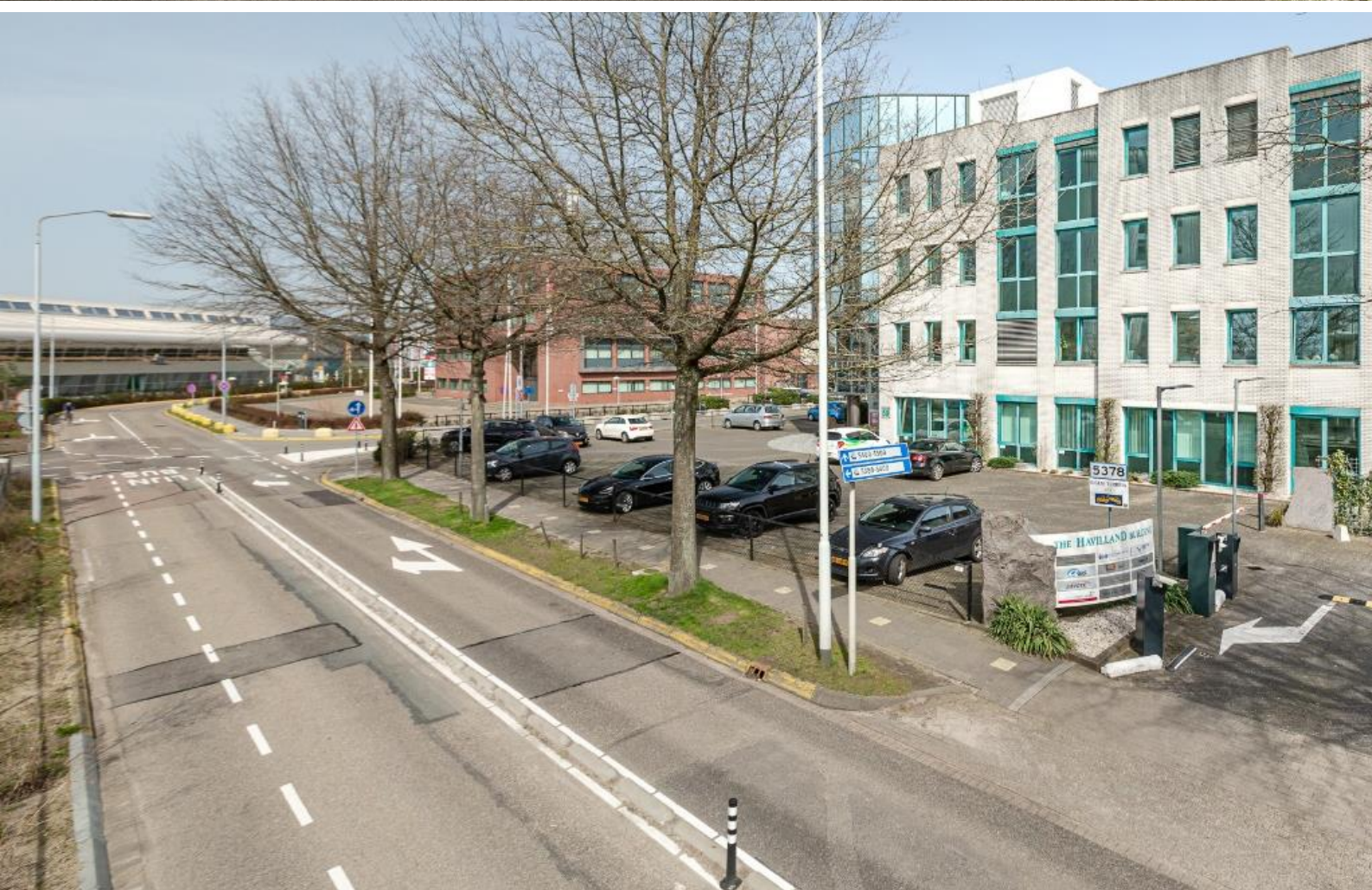
Luchthavenweg 59 te Eindhoven