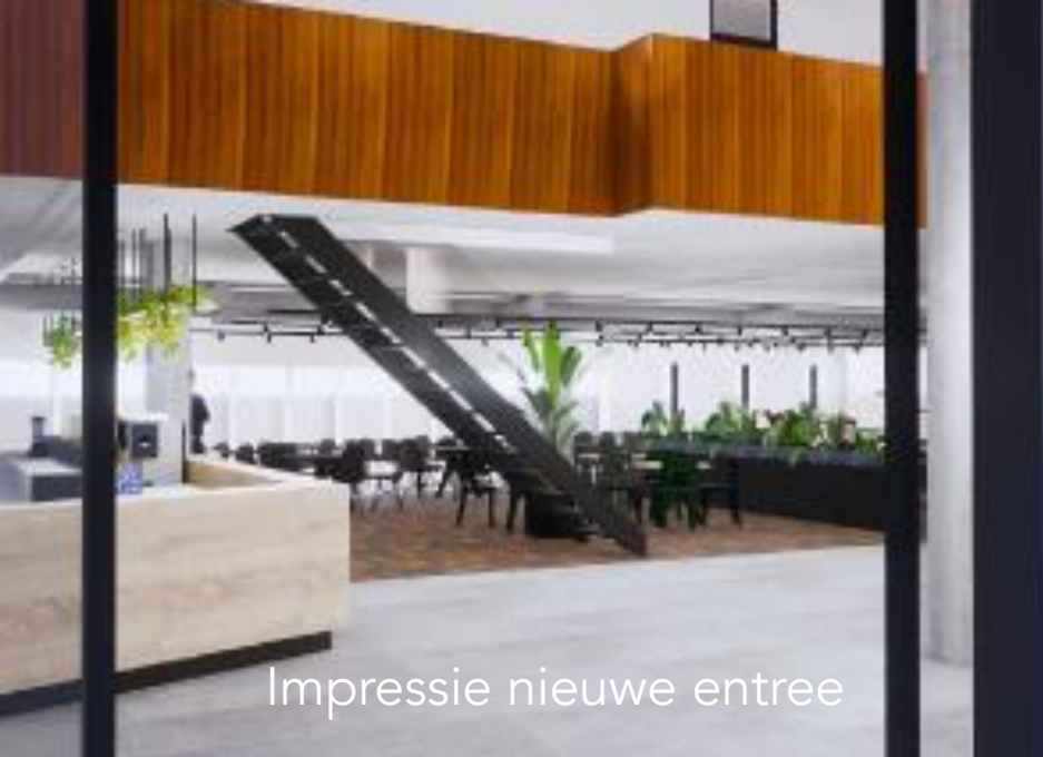
Impressie nieuwe entree